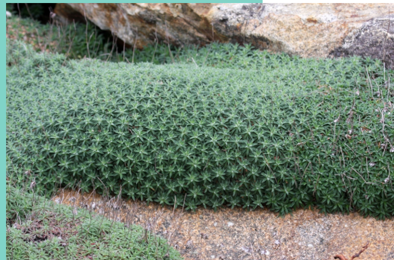
Herba de namorar cunha típica forma compacta e redondeada para adaptarse ás duras condicións dos cantís.