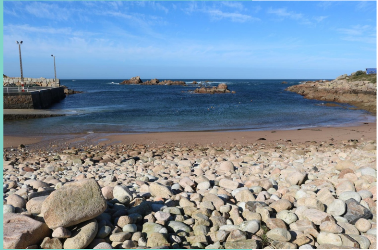
Praia da Lagoa Illa do Cu cagado Porto de Arou