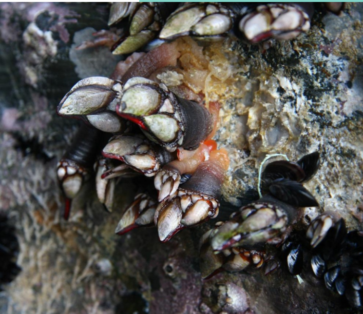
Percebes ( Pollicipes cornucopia ), o marisco máis representativo da Costa da Morte e un dos recursos máis importantes.