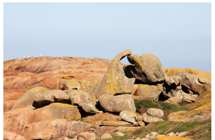
Punta do Capelo