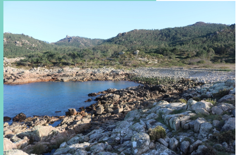
Rego e coído de Sabadelle