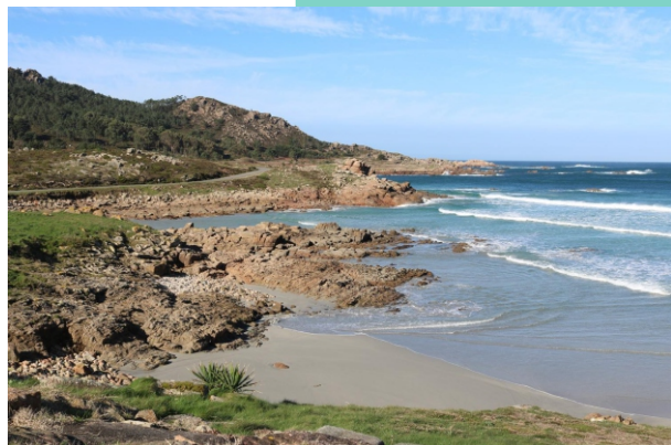
Petón da Furaqueira