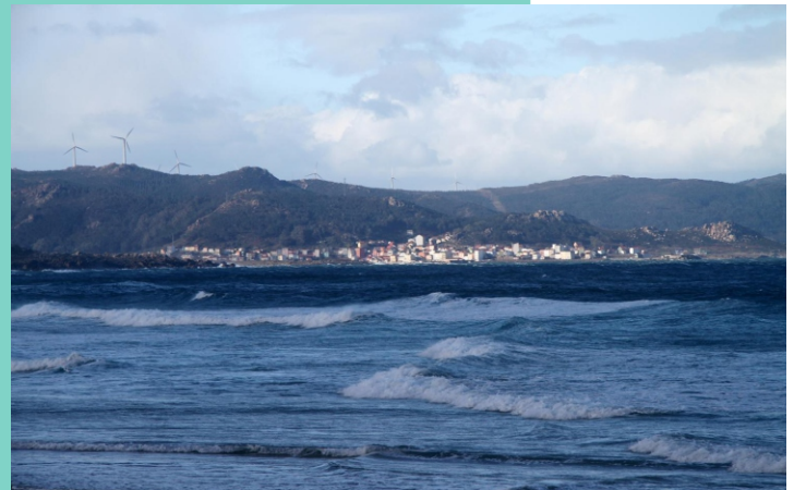
CAMELLE. Vila pesqueira instalada na enseada do mesmo nome, ao abrigo das puntas do Boi e A Falsa.