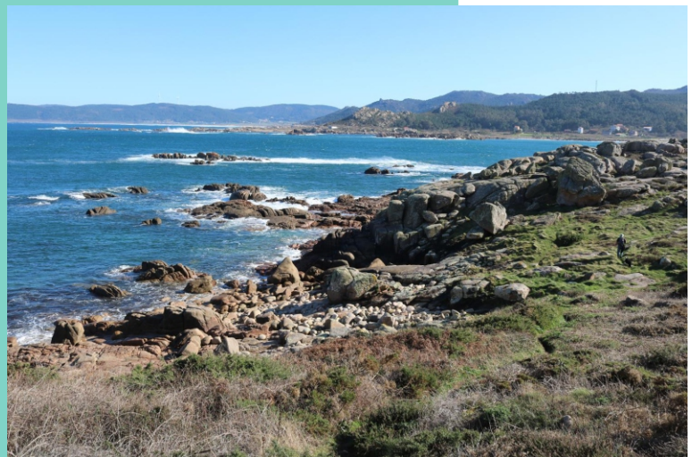
Punta das Lobeiras