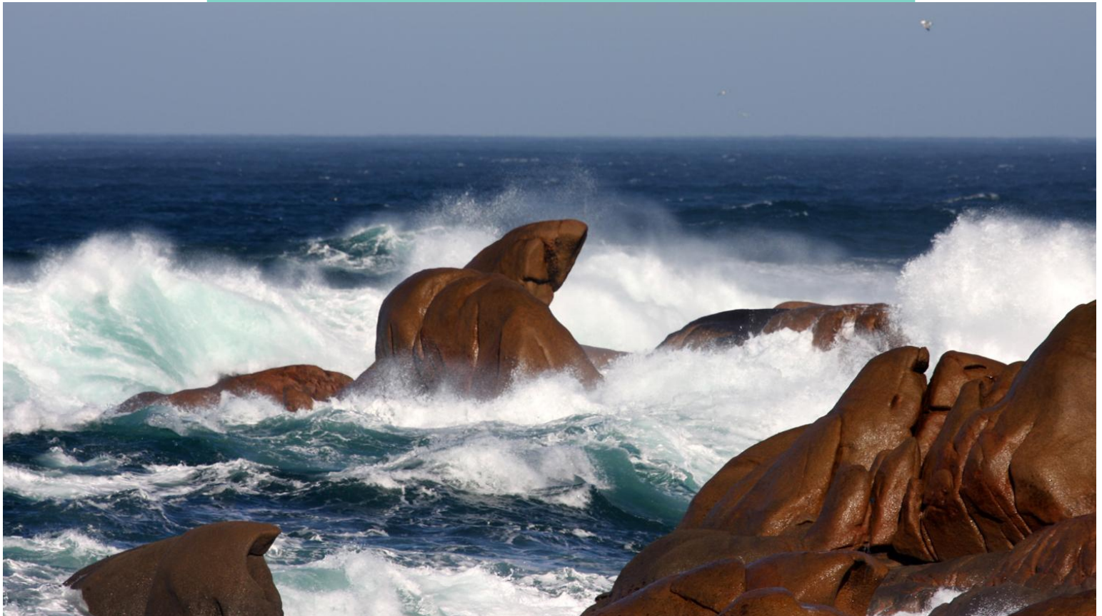
Punta do Capelo (Santa Mariña)