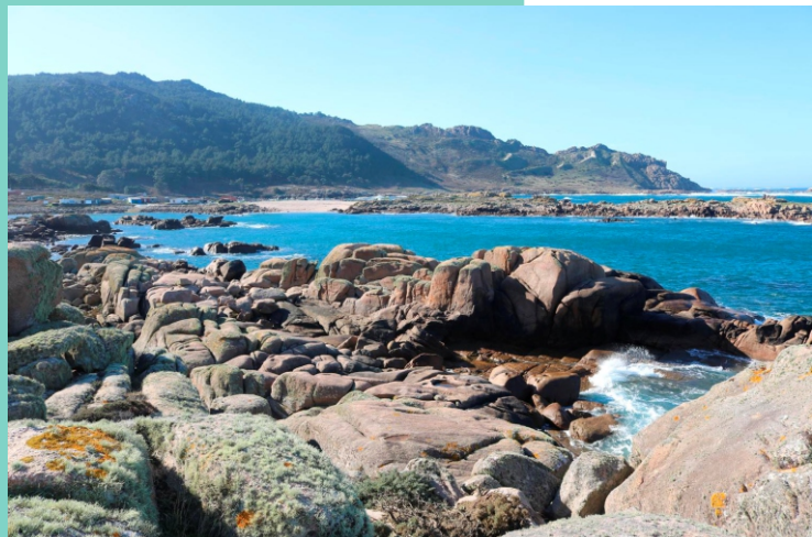
Pedra do Sal