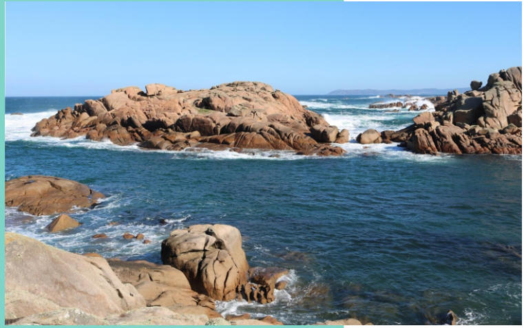
A Insuela. Os Boliños.