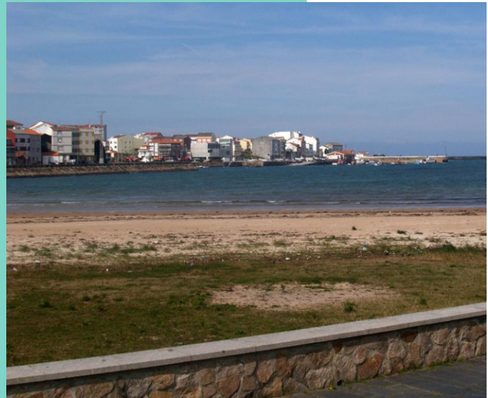
Praia e enseada de Camelle