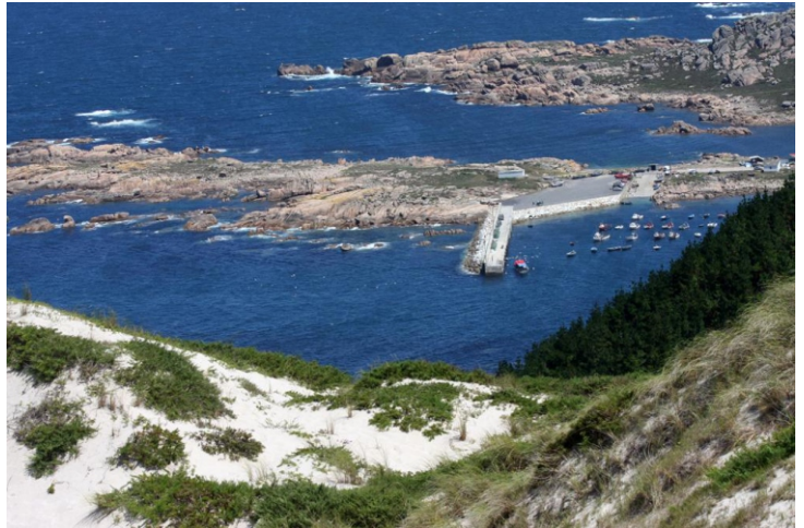
Punta e peirao de Santa Mariña desde o alto do Monte Branco.