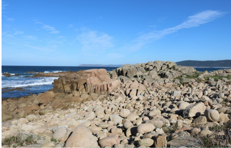
Coído de Xurelos