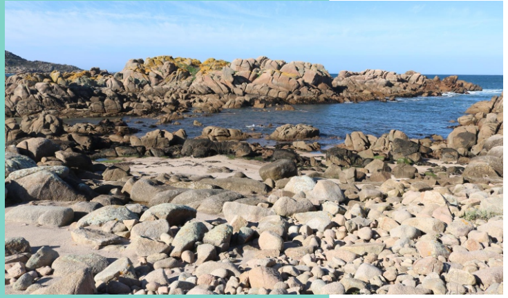
Punta do Curro