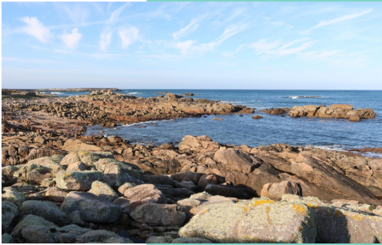
Enseada de Sabadelle