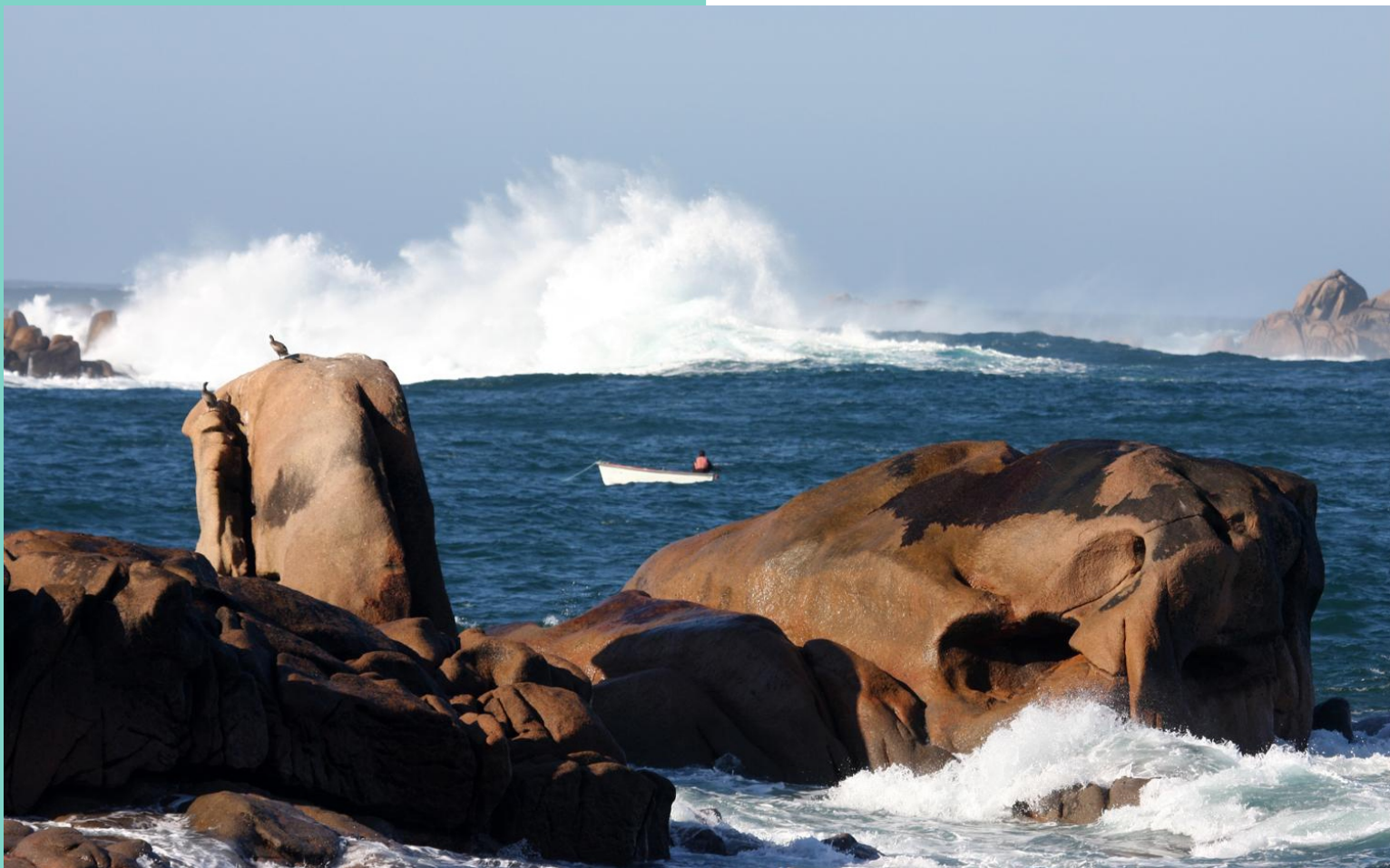
As laxiña e a Punta Batedora, en Santa Mariña