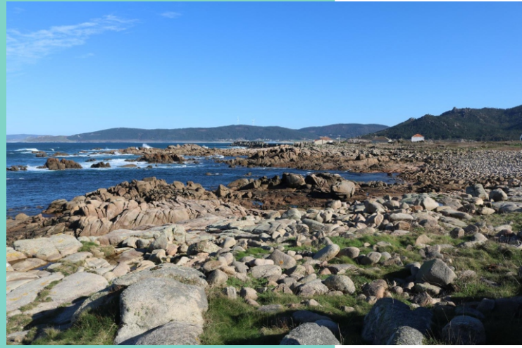
Punta do Frade. Seo da Fontiña .