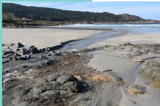
Rego do Canabal