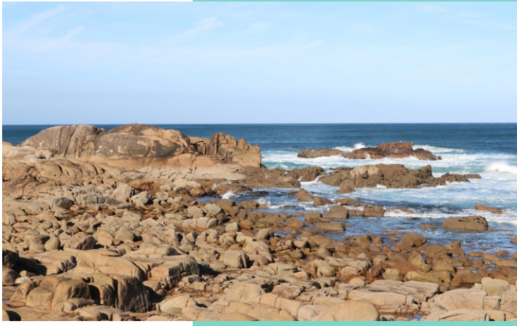
Punta do Boi.