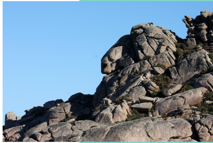
Seo de Cabanas