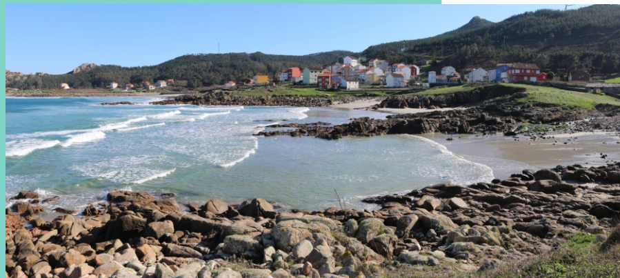
Praia Braña de Lazo