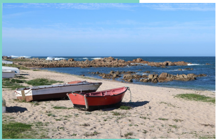
Praia das Lobeiras coa Ínsua e a Illa Negra