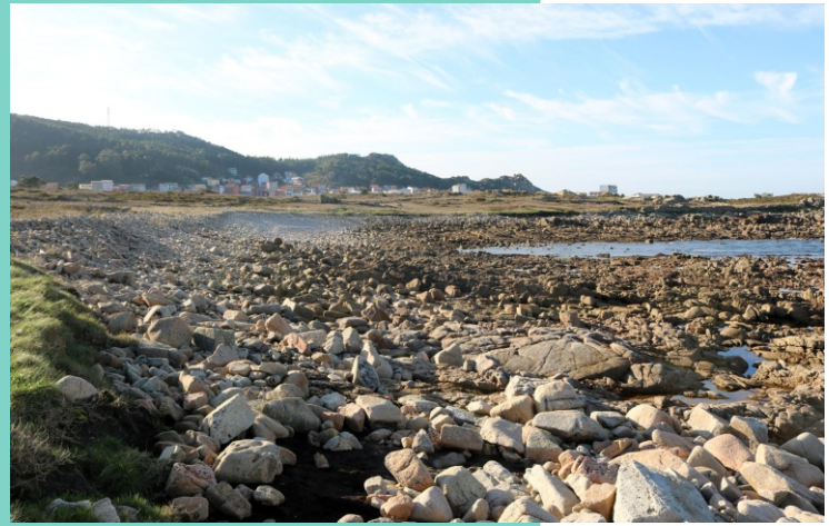
Punta e seo da Gandriña