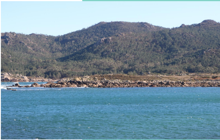
Punta da Falsa