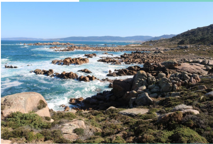
18-Punta Xunqueiras. Seo do Pelouro.