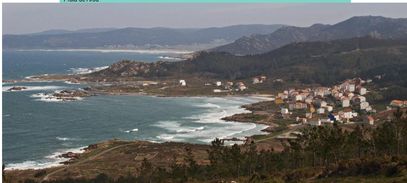
12-Arou. Vila mariñeira situada no fondo da enseada do mesmo nome, separado de Camelle polo contraforte rochoso da Punta Percebeira. No fondo da enseada conta con dúas pequenas praias, a de Arou e a de Braña do Lazo.