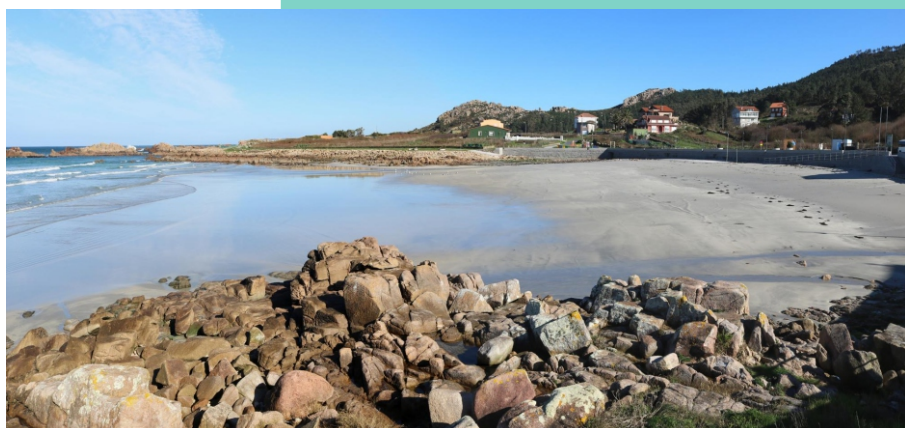
Praia de Arou