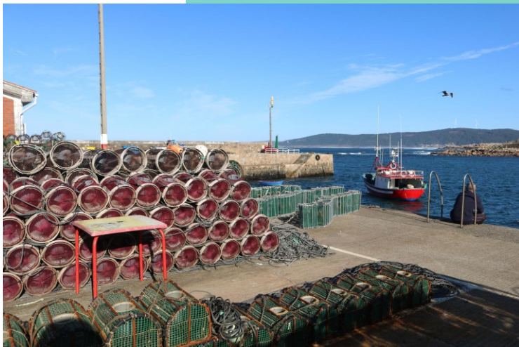
Peirao de Camelle