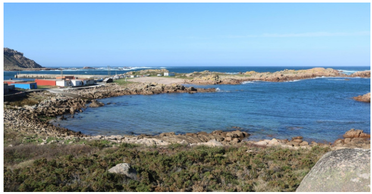
Santa Mariña, unha pequena localidade asentada nas abas do monte da Cruz. O seu porto está construído entre rochas vermellas nunha paraxe dunha beleza espectacular rodeada de formas traballadas polo mar e o vento.