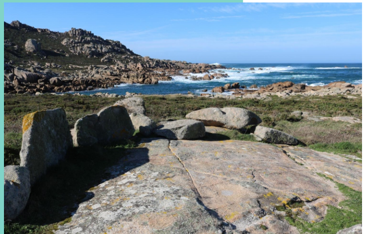
Punta do Cabalo